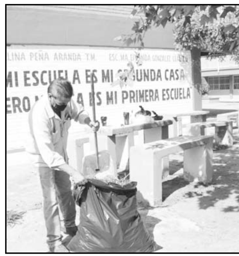
Unas 100 escuelas se limpiaron

Y para que resulte más efectiva esta labor de vigilancia, el Municipio solicita a la ciudadanía que reporte inmediatamente cualquier actividad sospechosa que observe