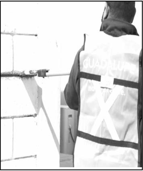
Se hicieron trabajos de pintura

También realizaron el mantenimiento de los Jardines de Niños “Pedro María Anaya”; “Solidaridad”; 20 de Noviembre; “Alfred Adler”; y “Diego de Montemayor” y en la Secundaria No. 2 “General Mariano Escobedo”, donde se reparó el drenaje en un área del plantel. (ATT)