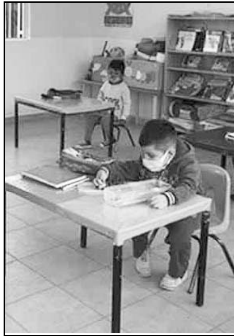
Los padres decidirán si van a las aulas

Lo anterior, debido a que es muy importante proteger primero la salud y la integridad de los pequeños, por ello reiteró que de ser necesario lleven a revisión médica a sus pequeños a fin de tomar una mejor decisión, en torno al regreso a clases presenciales. (ATT)