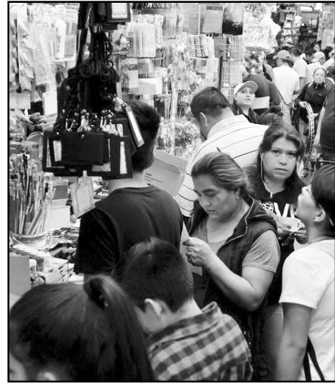
Acudieron padres a comprar útiles

Es así que este fin de semana se pudo ver a diversos padres de familia que se daban cita en tiendas del Centro de Monterrey para surtir la lista de útiles después de dos años de estancia en las aulas, y según los compradores, las escuelas no se pusieron muy